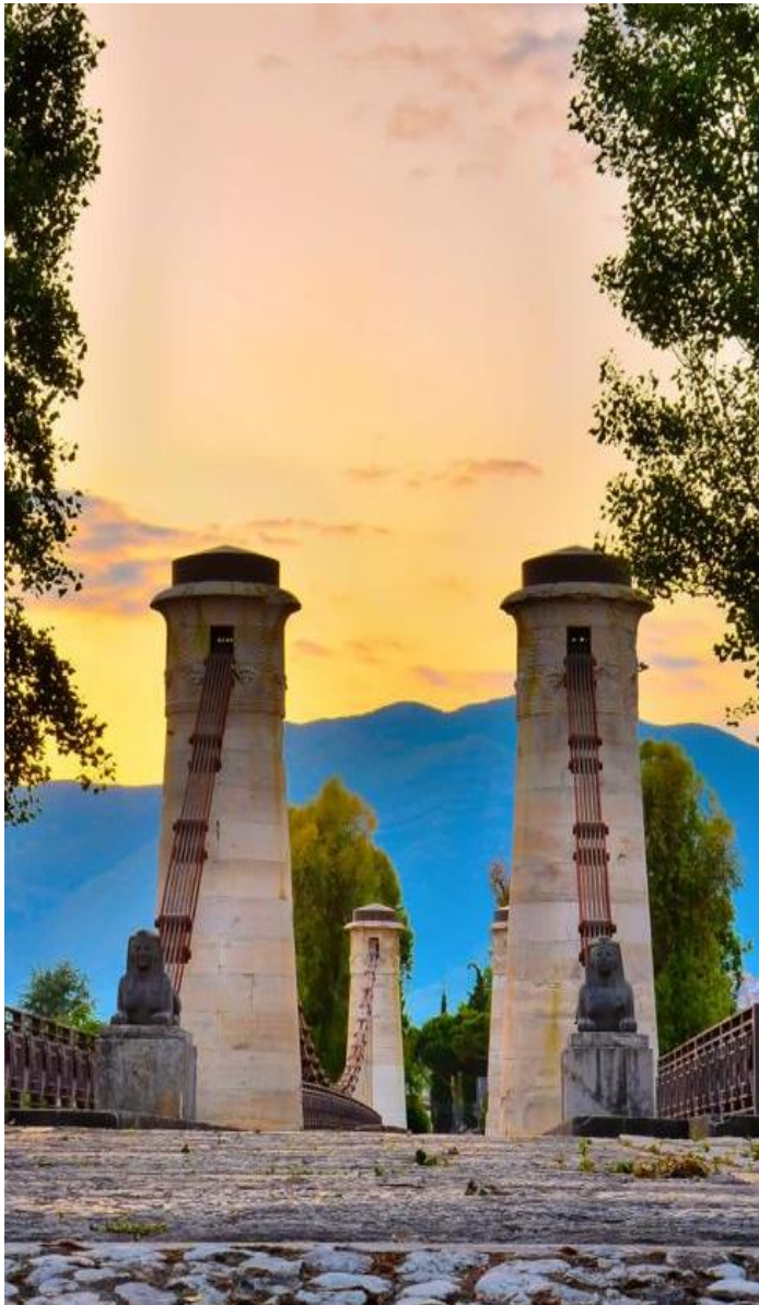
190° Anniversario del Ponte Real Ferdinando (1832-2022)