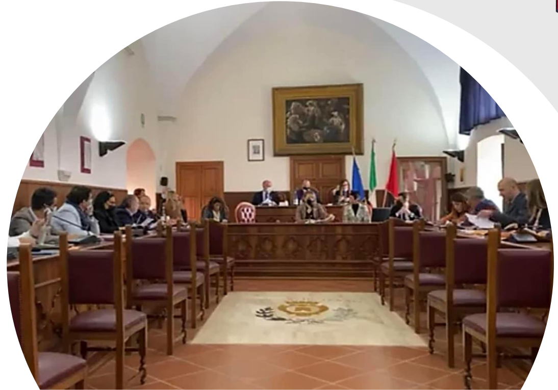
CONSIGLIO COMUNALE 2022